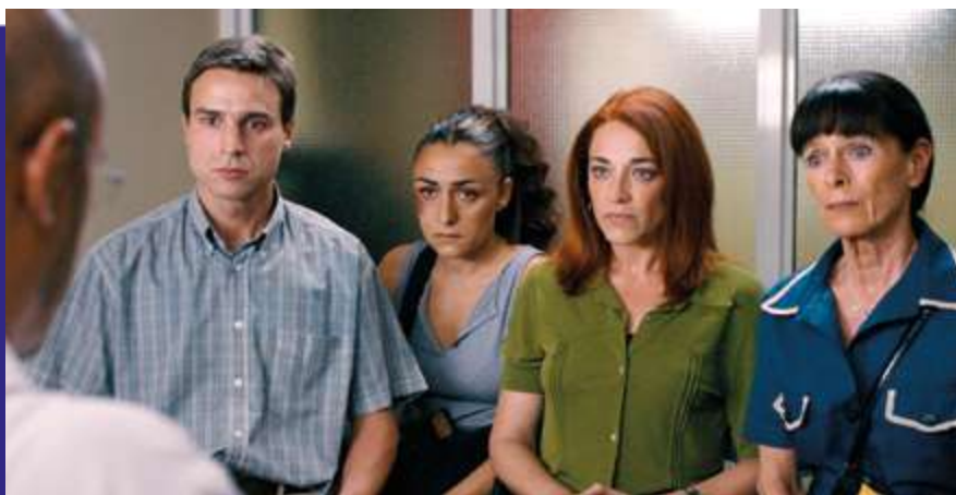
Photogramme du film “ L’Île intérieure ”.