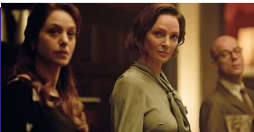
Photogramme du film “ Blackwood, le pensionnat ”.

Nominé à six Prix Goya, ce thriller met en scène un cadre supérieur espagnol qui doit jouer les médiateurs dans la prise d’otage d’un ingénieur en Afrique. Ce film est joué par Raúl Arévalo, Candela Peña et Paulina García. Las Palmas de Gran Canaria incarne une ville d’Afrique subsaharienne imaginaire.