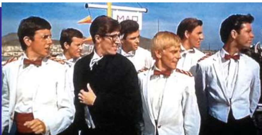
Photogramme du film “ Wonderful Life ”.