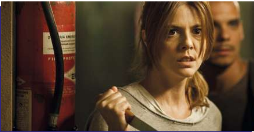
Photogramme du film “ [REC]4 ”.