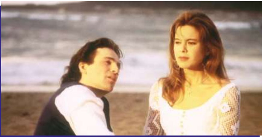
Photogramme du film “ Fotos ”.