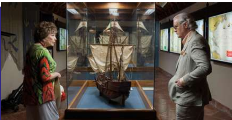
Photogramme du film “ Wild Oats ”.

Thriller sur le braquage d’une banque avec Raúl Arévalo, José Coronado et Raúl de la Serna. L’un des films ayant réuni le plus de spectateurs en 2016. Las Palmas de Gran Canaria est devenue la ville espagnole de Valence.