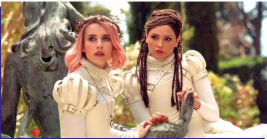
Photogramme du film “ Paradise Hills ”.