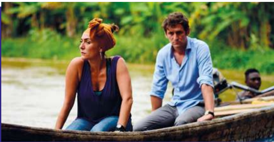
Photogramme du film “ Black Beach ”.