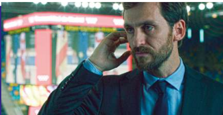
Photogramme du film “ Insiders ”.