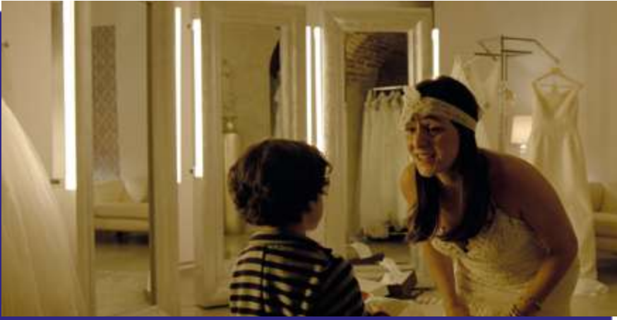
Photogramme du film “ Les brebis égarées ”.