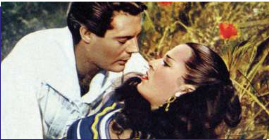
Photogramme du film “ Conquête héroïque ”.

Las Palmas de Gran Canaria prend les traits de La Havane dans ce film d'action produit par Netflix, qui relate l'histoire d'une tueuse à gages professionnelle qui est obligée de sortir de sa clandestinité pour sauver sa fille. Avec dans sa distribution Jennifer Lopez et Joseph Fiennes, ce film a réussi à faire venir en ville Ben Affleck, le mari de la star latina.