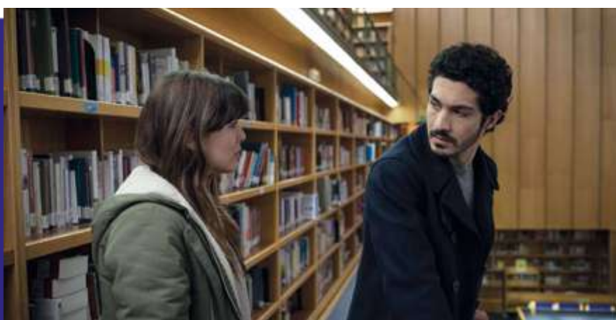
Photogramme du film “ Mirage ”.

Comédie musicale mettant à l’affiche Cliff Richard et The Shadows, clôturant la trilogie composée par « The Young Ones » (1961) et « Summer Holidays » (1963). L’un des films ayant le mieux photographié la ville.