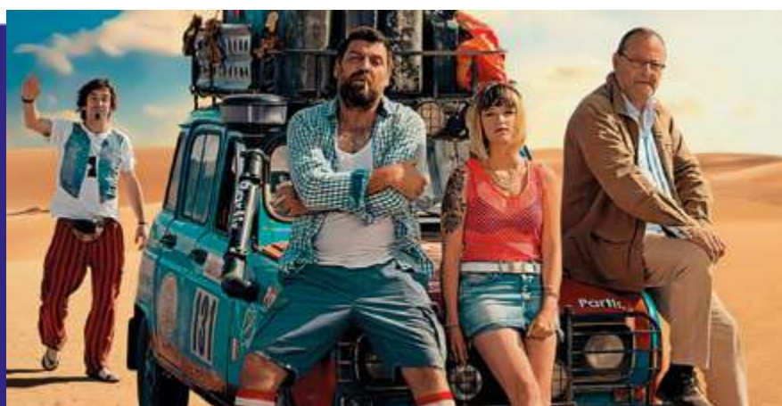
Photogramme du film “ 4L ”.

Tourné dans l'Himalaya à 6000 mètres d'altitude ainsi qu'à Gran Canaria, le quatrième film du réalisateur de « 1898, los últimos de Filipinas » décrit les aventures de Quique, qui voyage avec sa petite amie et son fils dans le nord de l'Inde. C'est là qu'un événement tragique va bouleverser sa vie pour toujours.