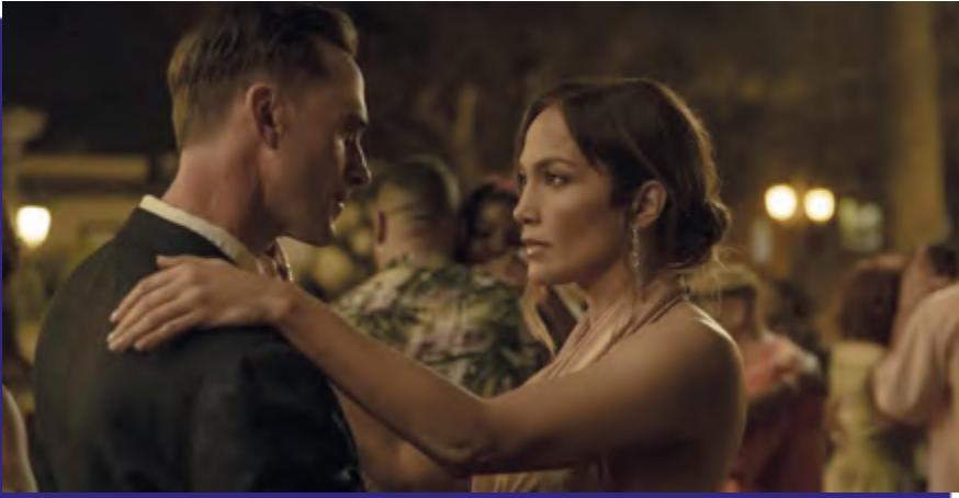
Photogramme du film “ The Mother ”.