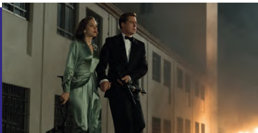
Photogramme du film “ Alliés ”.