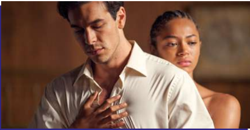
Photogramme du film “ Palmiers dans la neige ”.