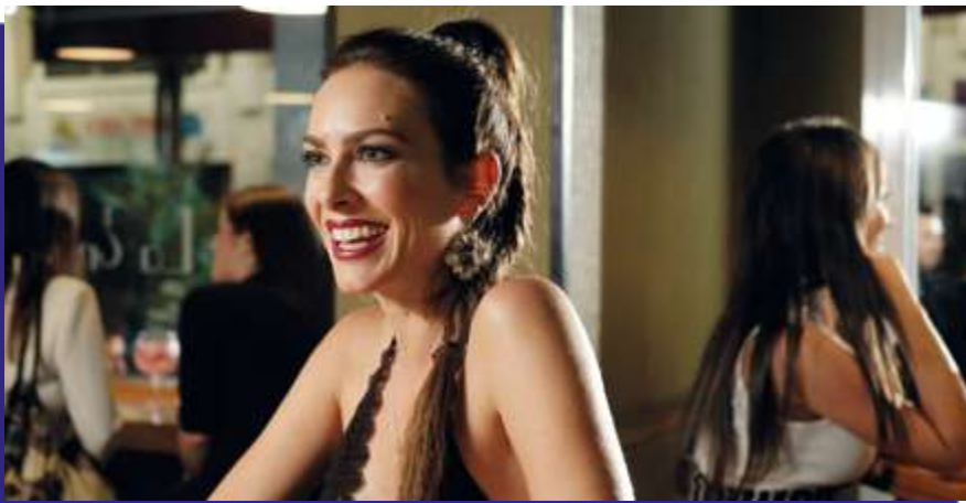
Photogramme du film “ La estrategia del pequinés ”.

Avec cette première œuvre, le réalisateur de Gran Canaria a remporté le prix du meilleur scénario et une mention spéciale du jury au festival de Sitges. Quentin Tarantino a fait l'éloge de ce film, extrêmement audacieux et étrange.