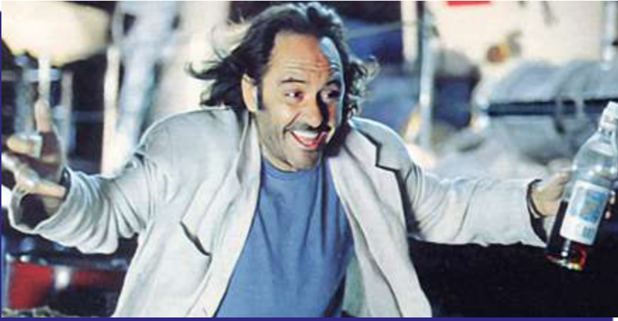
Photogramme du film “ Como un relámpago ”.