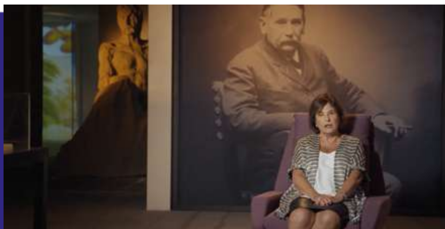
Photogramme du film “ Benito Pérez Buñuel ”.

Une production hollywoodienne avec Brad Pitt et Marion Cotillard qui raconte une histoire d'espions pendant la Seconde Guerre mondiale. « Alliés » a transformé Las Palmas de Gran Canaria en Casablanca, une ville du Maroc, et cette œuvre évoque le film mythique de Michael Curtiz mettant à l'affiche Humphrey Bogart et Ingrid Bergman.