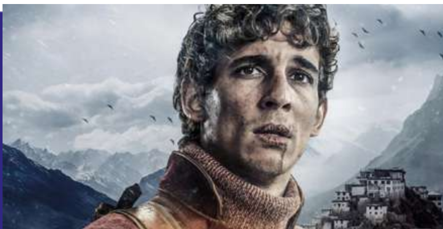
Photogramme du film “ Valle de sombras ”.