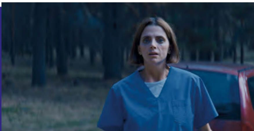
Photogramme du film “ El Hombre del Saco ”.