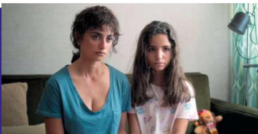
Photogramme du film “ Cuban Network ”.