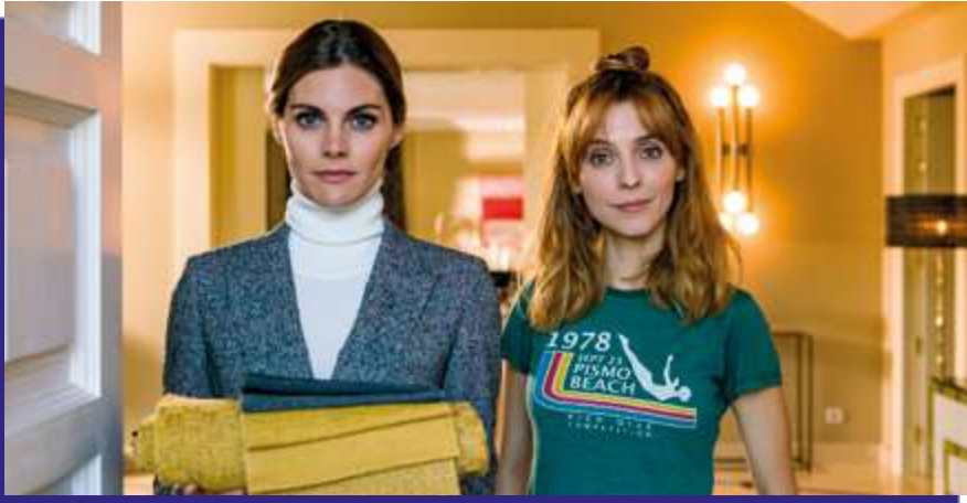
Photogramme du film “ ¿Qué te juegas? ”.