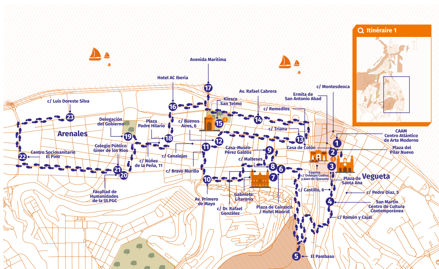
Carte de la ville de Las Palmas de Gran Canaria avec l'itinéraire un, passant par la zone de Vegueta et Arenales.