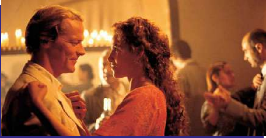
Photogramme du film “ Mararía ”.