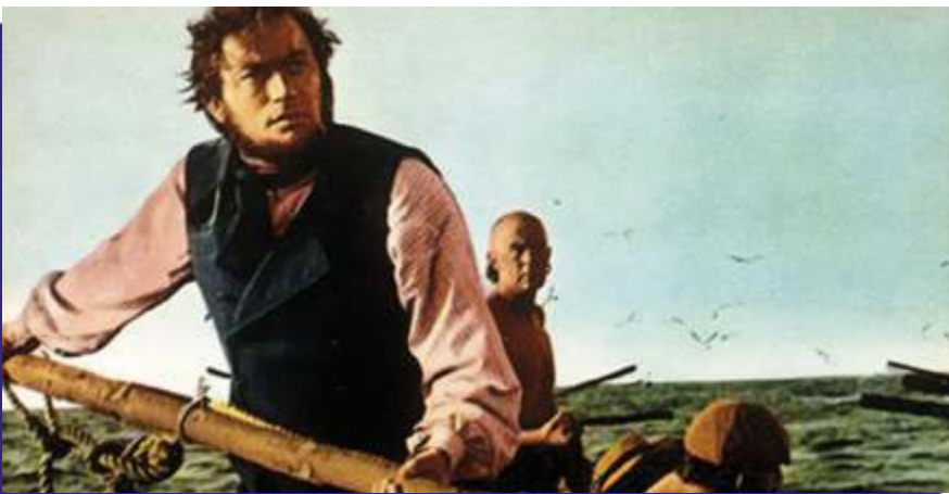
Photogramme du film “ Moby Dick ”.